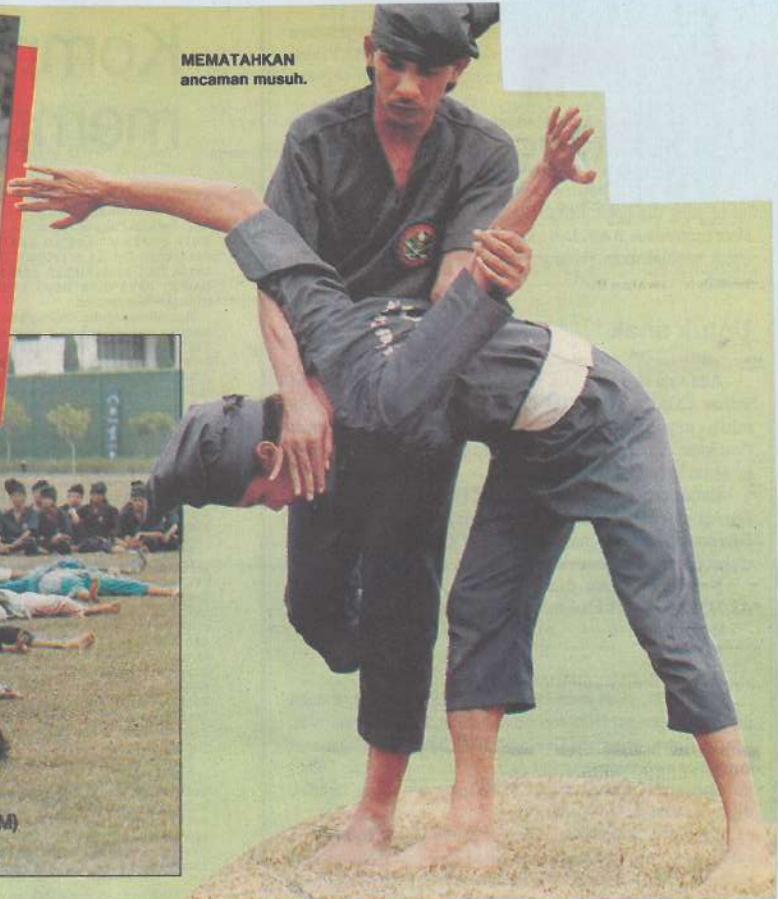
MEMATAHKAN ancaman musuh.